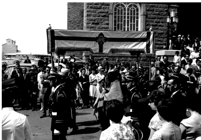
1965, Procession de la Fête-Dieu

Une dernière a eu lieu en 1965 pour les Fêtes du Centenaire de Saint-Félicien