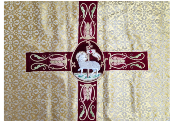
Détail d'un voile huméral