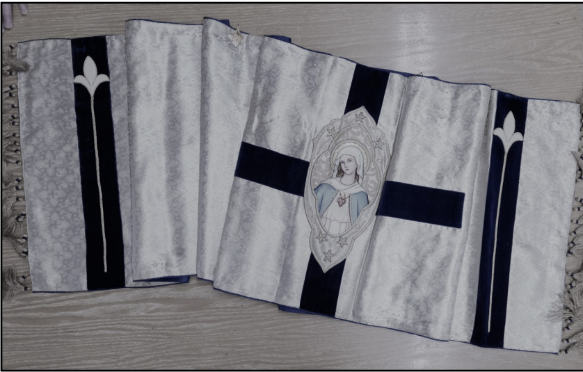
Voile huméral (porté sur les épaules pour l'exposition du Saint-sacrement et la reposition.