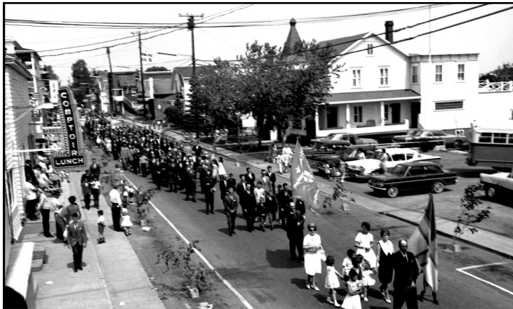
La maison Lamontagne et le comptoir lunch Verreault.