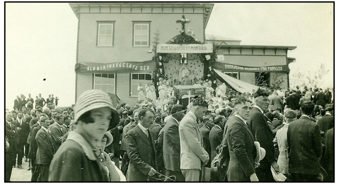
Procession de la Fête-Dieu,